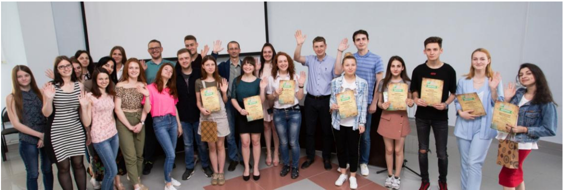
Награждение победителей конкурса-флешмоба #Общаяпобеда

просто. Ведь у всех нас: русских, белорусов, украинцев – есть уникальный ген – «ген победителя».