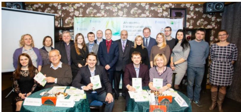
Презентация книги «Днепро-Двинский регион в зеркале социологии»

Будем и дальше стараться идти в ногу со временем!