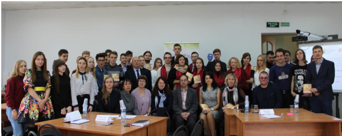
Российско-белорусский интеллектуальный баттл

Книгу презентовали на интеллектуальном баттле – игре, посвященной 75-летию освобождения российско-белорусского приграничья от немецко-фашистских захватчиков.