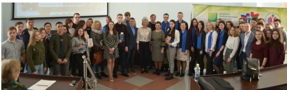
«Мастерская конструирования будущего: технологии форсайта и книги А. Азимова»

2019-й – это, конечно, традиционный для нас молодежный форсайт «Мастерская конструирования будущего», это виртуальный стихотворный флешмоб #Общаяпобеда, посвященный 9 Мая.