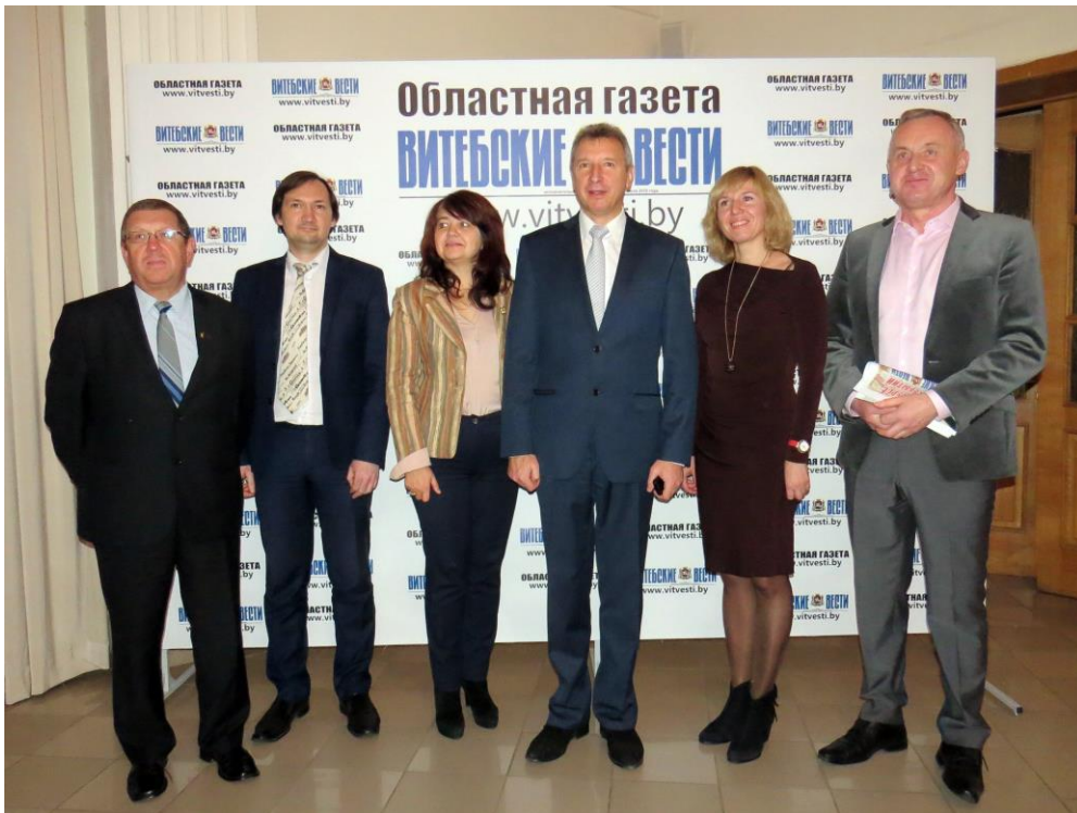
На фото: участники торжественной церемонии чествования «Витебских вестей»

Есть поговорка: хороший сосед равнозначен родственнику. Считаю, что дружба и взаимная помощь позволят нам увереннее смотреть в завтрашний день.