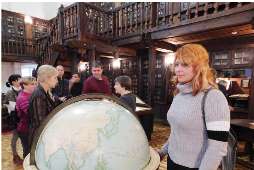
На фото: участники пресс-тура на экскурсии в Полоцке